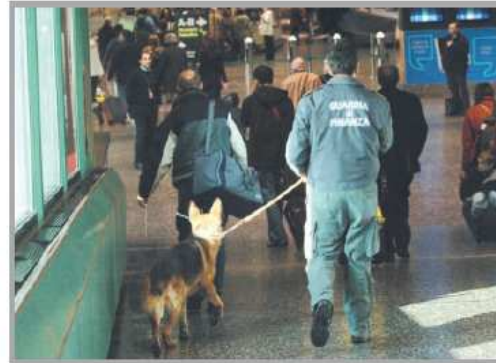
I controlli antidroga della finanza sono sempre più intensi

I corrieri, individuati grazie a una serie di parametri che tengono conto delle caratteristiche del passeggero e della provenienza del volo, sono stati trasportati in carcere a Busto Arsizio, dove si trovano tuttora a disposizione dell’autorità giudiziaria.