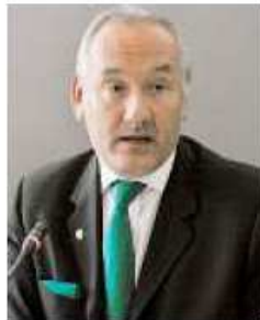
DAVIDE BONI Presidente del consiglio regionale (Lega)