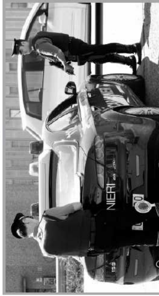
La trappola dei carabinieri è scattata ieri in un ristorante di via Padre Monti