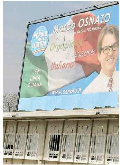
Uno dei manifesti elettorali al centro dell'inchiesta