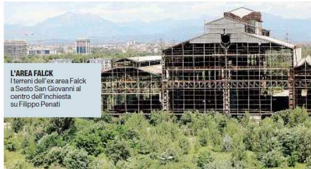
L'AREA FALCK I terreni dell'ex area Falck a Sesto San Giovanni al centro dell'inchiesta su Filippo Penati