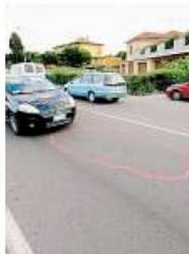
La strada dell’investimento